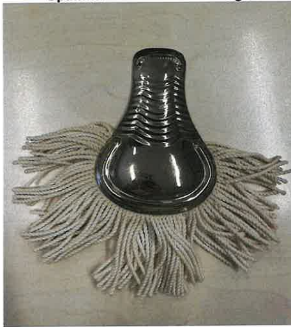
Rif.2.1 Spallina in metallo con frange

Per garantire la conformità tecnica e qualitativa dei prodotti offerti alle forniture precedenti è facoltà dell'offerente prendere visione degli articoli oggetto di gara presso il Comando del Corpo della Gendarmeria.