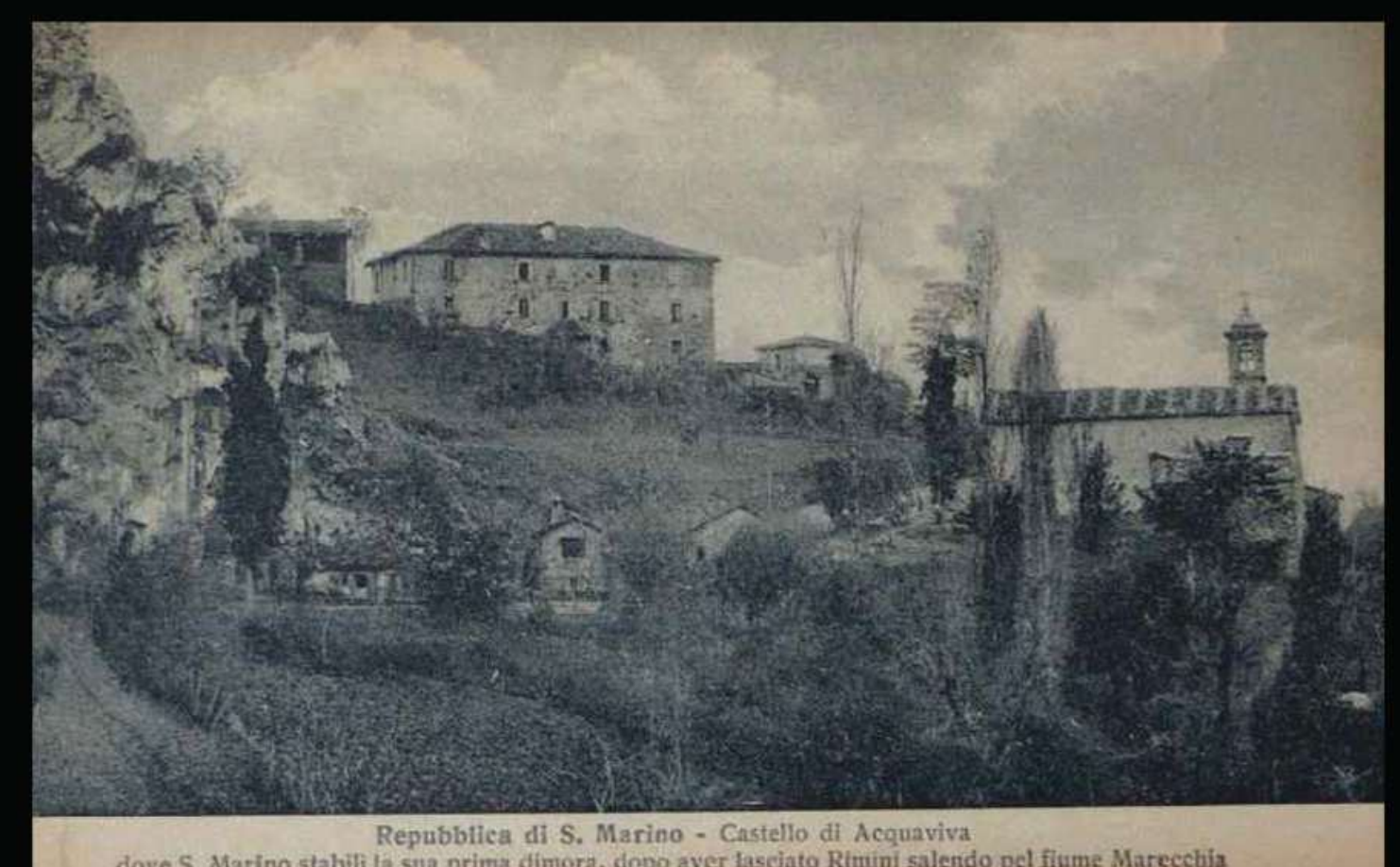
Repubblica di S. Marino - Castello di Acquaviva dove S. Marino stabilì la sua prima dimora, dopo aver lasciato Rimini salendo pel fiume Marecchia Cartolina dell'epoca: chiesa di S.Andrea sulla destra e Palazzo Masi al centro

Osservazioni in merito all'abitabilità: Già sgomberata dagli inquilini.