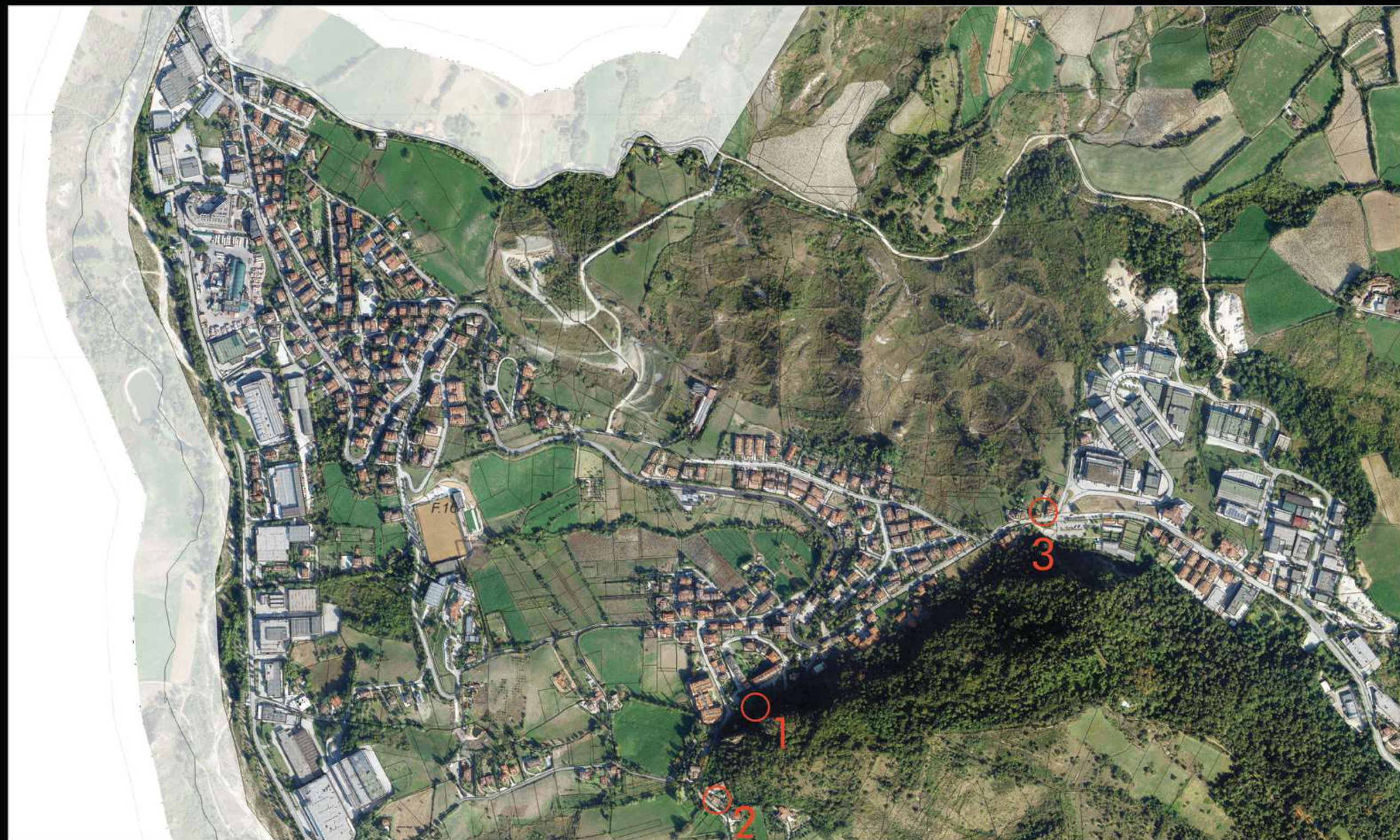
Catasto vigente su aerofotogrammetria 2018-Dipartimento Territorio e Ambiente, stralcio del castello di Acquaviva

Nel castello di Acquaviva risiedono ora 2.118 persone.